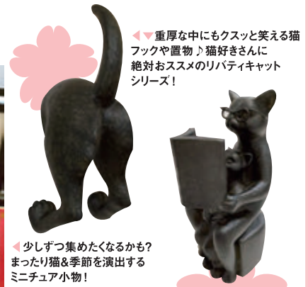
◀少しずつ集めたくなるかも？ まったり猫&季節を演出する ミニチュア小物！