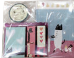
▲メモ手帳・付箋・マスクングテープ のセット。チャティクロス人気の ステーションナリーギフトです☆