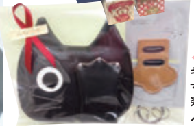
◀猫の手がポケットを挟んで キーの在処を教えてくれる マグネット付きキーリングや 楽しいデザインがロングランで 人気のカードケース