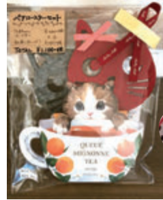
▲ねこの紅茶と人気の「たまちゃん」 コースターのセット

このシーズン限定のセット企画いろいろ♡ プチサイズのご挨拶ギフトからお祝いギフトまで、 ご予算、用途に合わせてお選びください！ また、店内でセレクトした商品のラッピングや複数の ギフト包装もお気軽にお申し付けください！