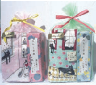
▲かわいいパッケージのお茶と ハンカチセット。春カラーでほっこり♪