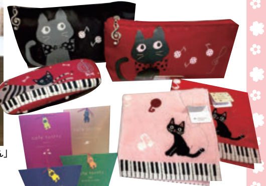
▲ポーチやハンカチ、メガネケース 音楽系ネコマニアグッズが人気♪